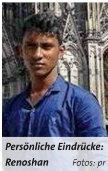
Persönliche Eindrücke: Renoshan

E inmal hatte ich einen Traum, nach Deutschland zu kommen. Aber mir war nicht bewusst, dass mein Traum in Erfüllung gehen würde. Diese wertvolle Chance bekam ich durch meine Partnerschule in Meschede. Die Realschule dort hat auf vielfältige Weise meiner Schule, NG/Thoppu in Sri Lanka, geholfen. Wir bekamen Möbel, Kleidung, Lautsprecher und Stipendien. Es gibt keine Worte dafür, wie wir ihnen Dank sagen sollen.