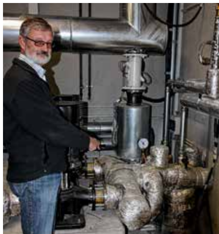
Über in der Zentrale noch 130 Millimeter dicke Rohre wird von hier aus das Dorf im 5,5 Kilometer langen, bald verästelten Netz versorgt.

Solange Strom noch durch das Gesetz für erneuerbare Energien gefördert werde – so die Überlegungen –, könne er eine Zeit lang Wärme für ein mögliches Vorhaben der Dorfgemeinschaft relativ preiswert abgeben. „Wochen später“, berichtet Ingenieur