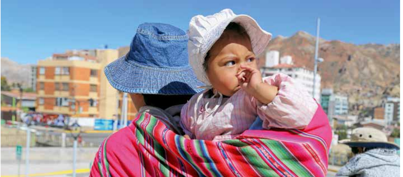
Bolivien: ein Bild aus La Paz. Kinder und Jugendliche, aber auch alte Menschen benötigen Schutz in einer Gesellschaft, in der viele um ihre Existenz kämpfen. Aber gerade um sie kümmert sich in den großen Städten kaum jemand. Mit zielgerichteten Projekten kann die Caritas ihnen und den Älteren ein Stück Zukunft geben.

entstehen kann. Es kostet die Menschen unendliche Kraft und Arbeit, dem kargen Boden das Lebensnotwendige abzurufen. Natur hier ist lebensfeindlich; soweit das Auge reicht, gleicht sie einer Mondlandschaft. Verwunderlich, wie es trotzdem einzelnen Bäumen gelingt, im rauen Wind Kronen gen Himmel zu strecken.