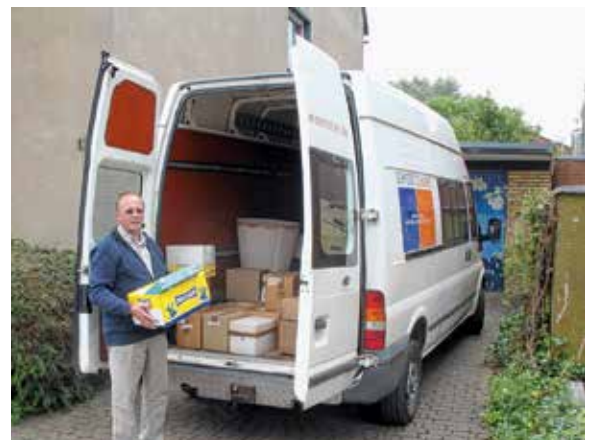
... auch durch Anpacken bei Wohnungsaufösungen zu Hause.