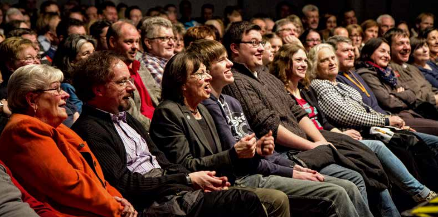
Gesichter, die unterschiedlichste Emotionen spiegeln. Kultur bewegt. Das zu vermitteln ist Ziel der Macher von Kultur pur in Bestwig.