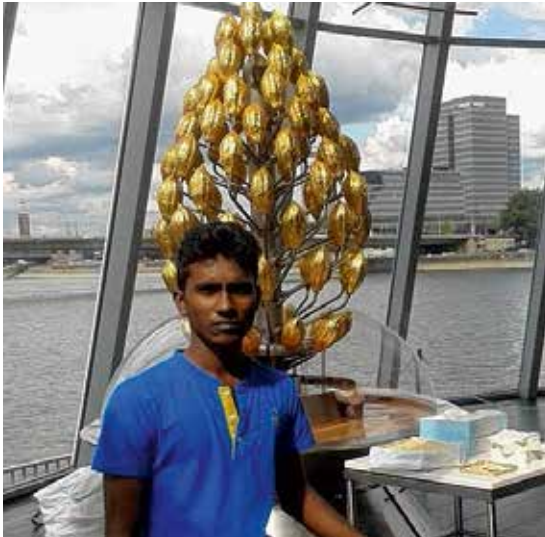
... und vom Schokoladenmuseum nah am Rhein.