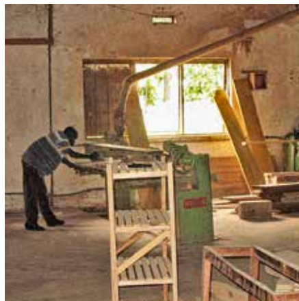
Handwerksausbildung in Afrika, mitfinanziert...

beengt zu acht im Zimmer. Es ist noch viel Unterstützung der Wohltäter/-innen aus Deutschland nötig, um dieses gute Projekt auf sichere Füße zu stellen.“ Denn „Bildung ist Zukunft: Mit einer hochwertigen Ausbildung können die jungen Menschen eines Tages Verantwortung in ihrem Land übernehmen.“ In Uganda,