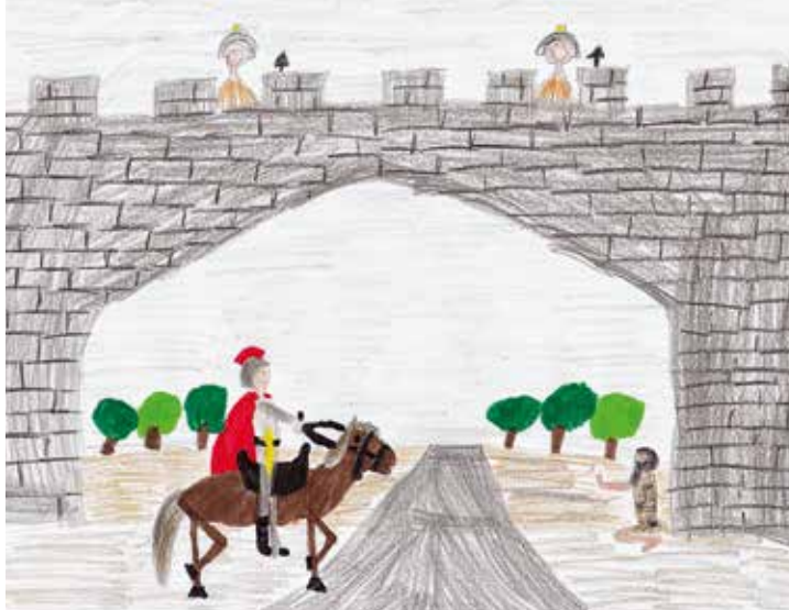
„Martin und der Bettler vor Amiens“. Johanna Streich malte das Bild 2012. pr

Teilen wie St. Martin ist hochaktuell. „Und diese Martinsgeschichte vom Teilen ist einfach unveränderbar“, ist Grosser überzeugt. Für Calle gilt auch: Das Teilen und Verschenken wird konkret, weil jährlich abwechselnd mehrere Gruppen aus dem Dorf dafür geradestehen, dass Brezel verschenkt statt gekauft werden. „Dafür sorgt mal die Frauengemeinschaft, mal das Büchereiteam, der Sportverein oder die katholischen Arbeitnehmer“, freut sich Grosser. Das sei ein Zeichen für Verwurzelung in der Heimat. Anderswo in Deutschland und NRW teilen zu St. Martin auch Kinder selbst – etwa in Projekten an Schulen.