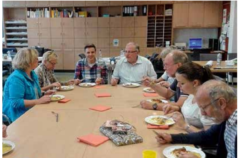
Zum Abschied gab es im Kollegium ein asiatisches Essen aus Sri Lanka.

ganz anderen Zeit in Deutschland und der menschenverachtenden Vernichtung von Leben bis 1945 gelernt habe.