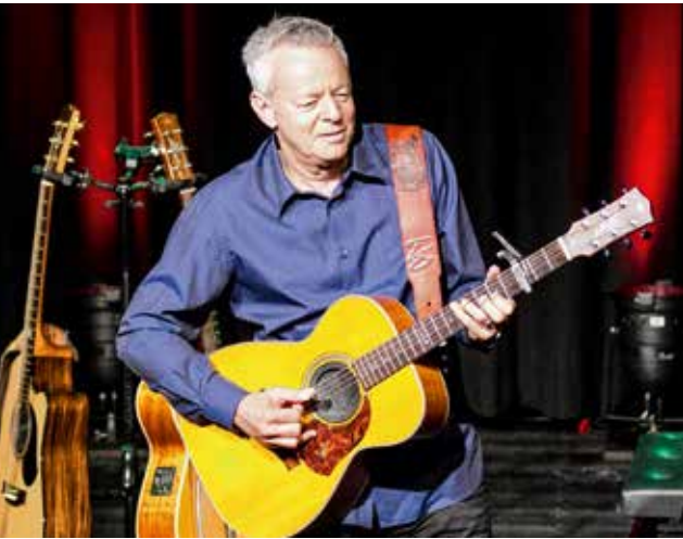
Kultur in Bestwig: Ehrenamtler 28 holen auch Weltstars in die Heimat.