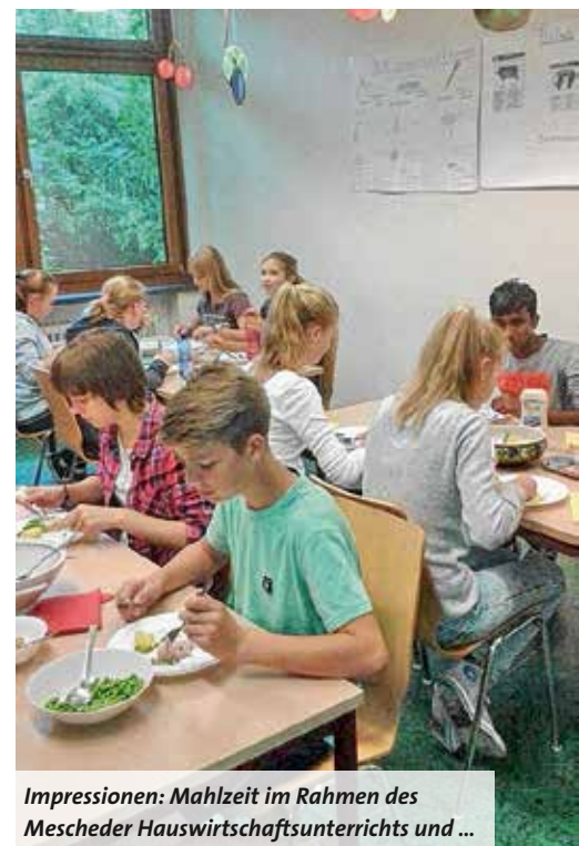
Impressionen: Mahlzeit im Rahmen des Mescheder Hauswirtschaftsunterrichts und ...

Kaum Worte finde ich bis heute zu Eindrücken unseres Besuchs im früheren Konzentrationslager Sachsenhausen. Denn Worte könnten wertvolle Erfahrungen, die ich von dort mitnehme, kaum erklären. In dauerhafter Erinnerung wird Sachsenhausen mir bleiben, weil ich auch auf Sri Lanka in meinem Geschichtsunterricht manches von der