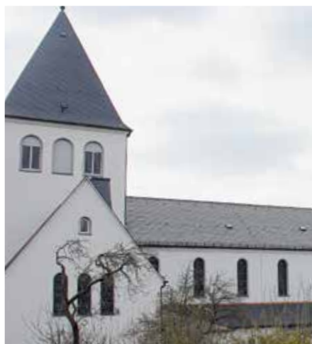
Kirche(n) und Glaube. Wie kann er auch zukünftig für Menschen Heimat sein?

Verlieren wir ein Stück Heimat, wenn die Kirche sich verändert? Wenn nicht mehr jede Gemeinde einen eigenen Priester hat? Wenn das liturgische „Programm“