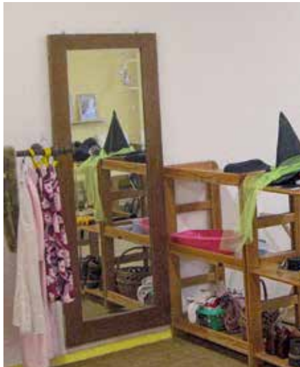
Verkleidungs- sowie Puppen- und Spiel-ecken. Typisch für deutsche Kitas.

Die Deutschen lernten, dass ihre Kolleginnen zwischen drinnen und draußen unterscheiden. Nur im Haus gibt es Spielzeug – oder vielleicht wie in deutschen Kitas eine Verkleidungs- oder Puppenecke. Aus Sicht der Israelis dient dieses Konzept dem Vertraut-Werden mit Dingen der realen Welt. In den Röhren des Straßenbaus etwa konnten die Kleinen Hütten einrichten. Auf täglichen Wanderungen lernten sie Genießbares kennen, was sie vor Ort aßen. Ganztagsbetreuung,