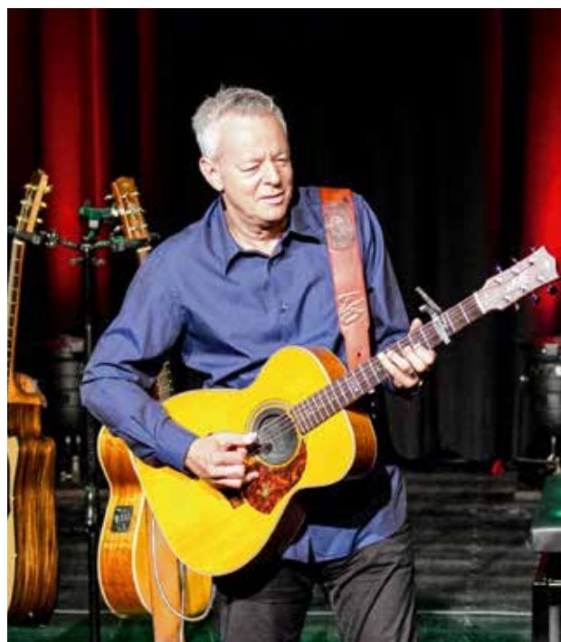
Weltstars zu Gast. Auch Tommy Emmanuel kam nach Bestwig.