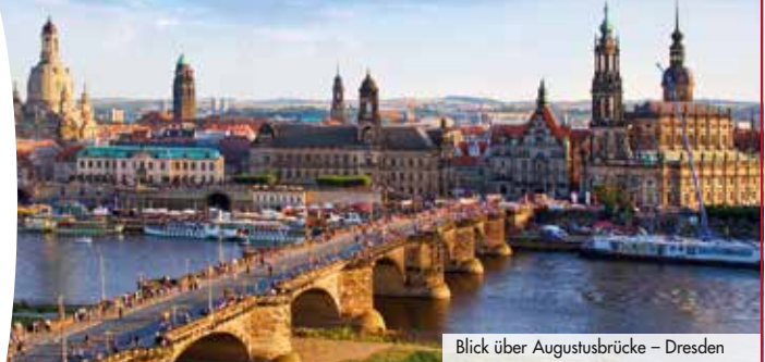
Blick über Augustusbrücke – Dresden

Bequem und stilvoll reisen Sie ohne Umstieg im nostalgischen 1. Klasse-Sonderzug AKE-RHEINGOLD nach Dresden. Freuen Sie sich auf großzügigen Sitzkomfort und reichlich Beinfreiheit. Im Speisewagen wird frisch gekocht – wie in der „guten alten Zeit“. Und aus der Glaskanzel des Panoramawagens bieten sich Ihnen allerbeste Aussichten, während Sie sich in rascher Fahrt Ihrem Reiseziel nähern.