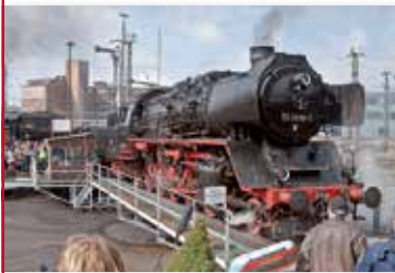
Eisenbahnspektakel in Dresden