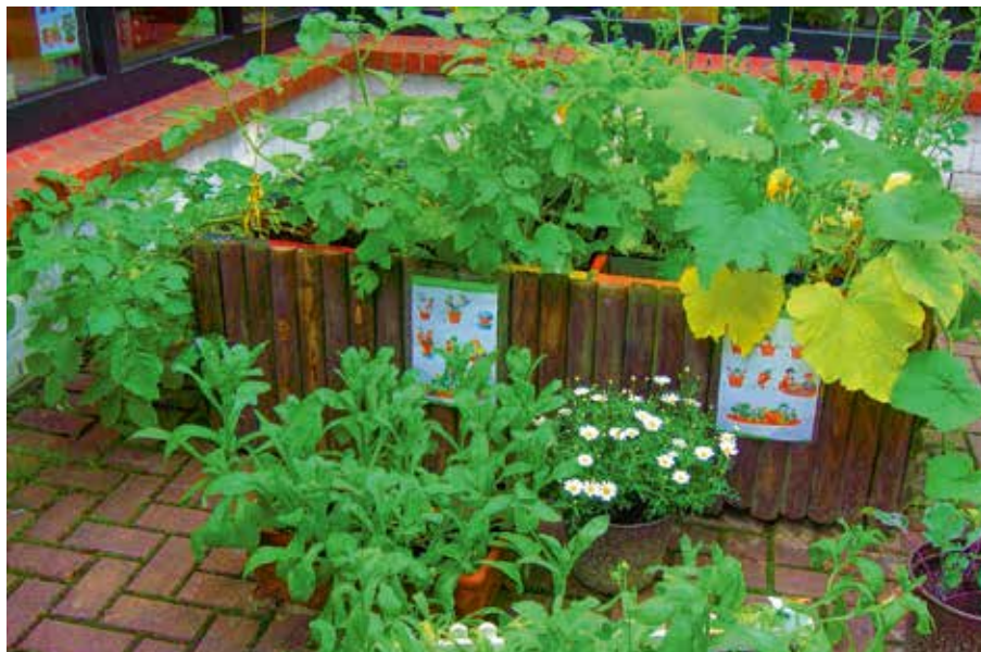
Die Beete in der Kita im Juli: Das ganze Jahr über sahen die Kinder, wie das Gesäte wuchs.

Für die Kinder wird es zum Abschluss des Projektes noch eine besondere Auszeichnung geben. Sie erhalten das Zertifikat „Gartenkinder“. Das von den Landfrauen bereitgestellte Material bleibt selbstverständlich in der Kita und kann für weitere Gartenkinder genutzt werden.