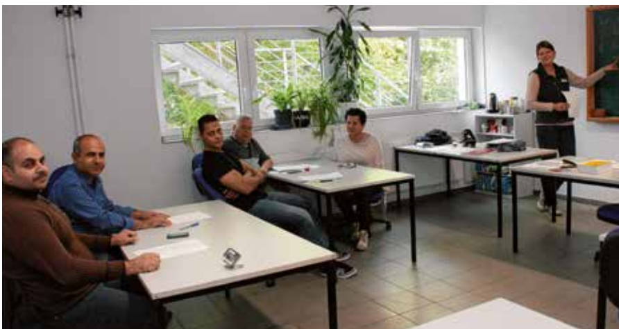
Täglich fünf Stunden Deutsch lernen: Das ist überlebenswichtig im Alltag wie im Beruf.