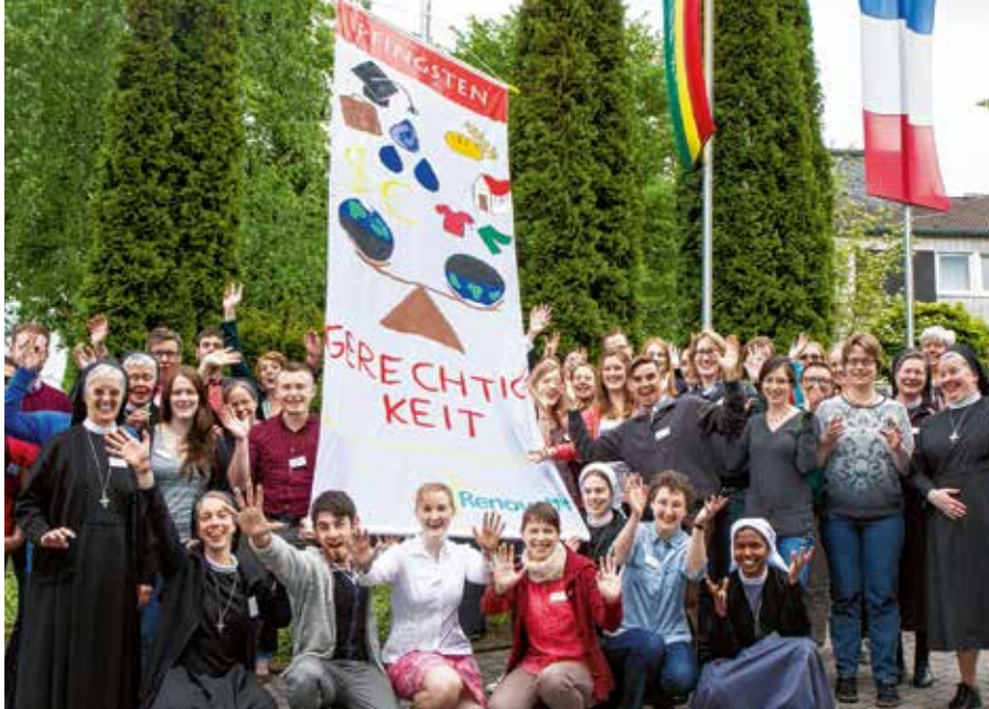
Den Begriff Berufung fassen die Schwestern weit: Auch das internationale Pfingsttreffen bietet jungen Menschen bis 35 Jahren die Möglichkeit, sich ihres eigenen Lebensweges zu vergewissern.

Viele Angebote für junge Menschen im Bergkloster Bestwig seien darauf angelegt, den roten Faden und den Sinn im eigenen Leben zu finden: ob bei der gemeinsamen Feier der Kar- und Ostertage,