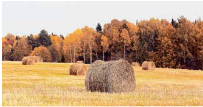
Herbstfelder. Symbol für den Ertrag der Schöpfung.