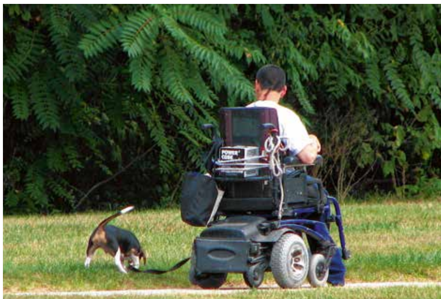
Unterwegs mit Handicap und Hund. Für Menschen gilt, dass sie ihren Alltag annehmen lernen und mit Einschränkungen umgehen müssen. Dass dies besser gelingt, ist Ziel von Selbsthilfegruppen. MS-Kranke sind heute weniger als früher auf einen Rollstuhl angewiesen.

Infos im Internet: www.dmsg-nrw.de ; auch: www.dmsg.de .