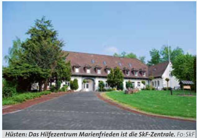
Hüsten: Das Hilfezentrum Marienfrieden ist die SkF-Zentrale.