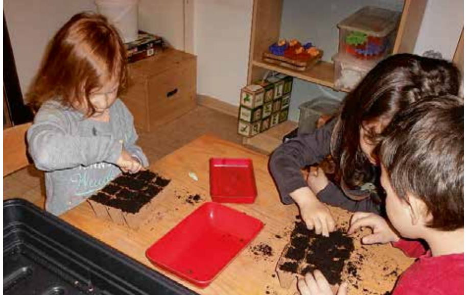
Spaß und Konzentration. Für „Gartenkinder“ beginnt alles mit dem Säen oder Pflanzen in Mini-Töpfchen.

„Geschätzt haben bisher mit den Landfrauen etwa 500 Vier- bis Sechsjährige gelernt, dass Erbsen und Möhren nicht