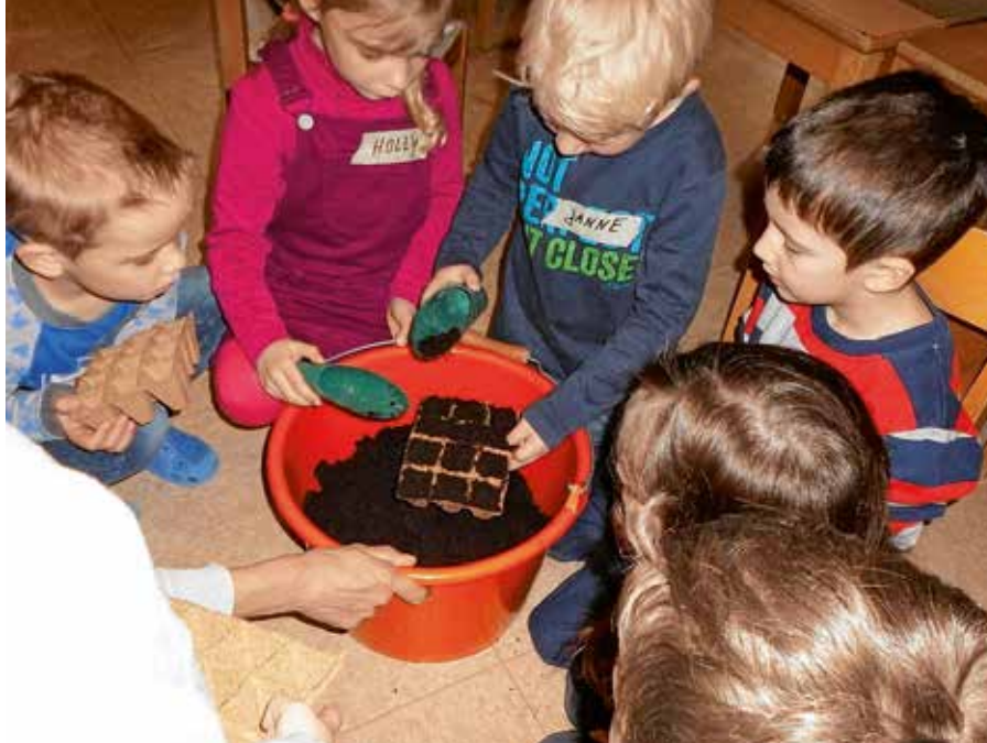
Die Ramsbecker Kinder im Frühjahr: Was einmal groß werden und wachsen soll, muss gut „versorgt“ werden.

„Schade, aber die Schnecken haben ja auch Hunger“, meinten die Mädchen und Jungen. Die anderen Pflanzen gediehen prächtig. Die Feuerbohnen ragten sogar bis zur Dachrinne, was nicht nur die Kinder toll fanden. „Auch die Eltern schauen sich die Pflanzen an. Und unser Projekt