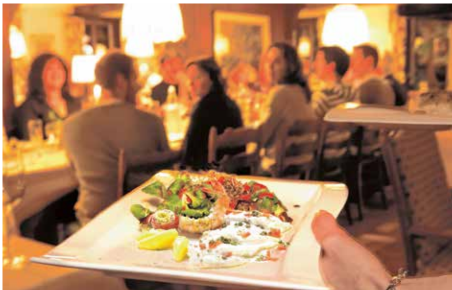
Die Gastronomie im Sauerland hat sich einen guten Ruf erarbeitet. Das Land der 1000 Berge kann in manch einem seiner Betriebe zudem mit persönlich geprägtem Service punkten.

Schütte: Im Frühherbst sind Hase, Fasan und kleinere Tiere eine gefragte Delikatesse. Ein Brunfthirsch, das weiß jeder passionierte Jäger, käme da nie auf den Tisch. Jetzt im Spätherbst ist es junges Rotwild, das gut schmeckt und speziell zubereitet die gute Sauerländer Küche auszeichnet.