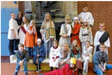
Kinder erleben Theater ... und die Bibel. ib

Und wo jemand vergibt, schenkt Gott und schenken sich Menschen Frieden. Unverzichtbar sind jährlich die Stars der KIBIWO-Band, deren Unterschriften die Kinder auf ihren Liederheften sammeln. Zu den Tagen von Donnerstag bis Sonntag gehörten auch Gesprächs- und Singzeiten, Spiele, Gottesdienste ... Ein Fazit? Nach allen Jahren ist die ökumenische Bibelwoche für Kinder, 60 ehrenamtliche Mitarbeiter und Hauptamtliche aus evangelischen und katholischen Gemeinden immer ein Gewinn. Warum, erklärt Brüggemann. „Dieses große