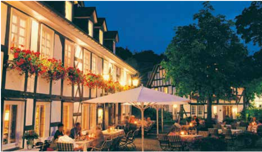
Hinter dem traditionsreichen Haus: der Hof des Landgasthofs bei Nacht.