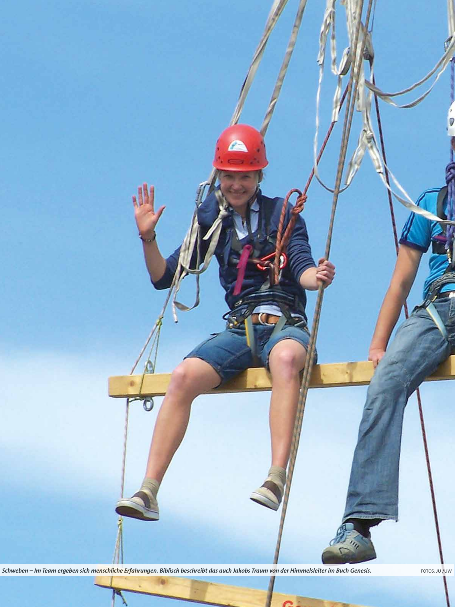
Schweben – Im Team ergeben sich menschliche Erfahrungen. Biblisch beschreibt das auch Jakobs Traum von der Himmelsleiter im Buch Genesis.