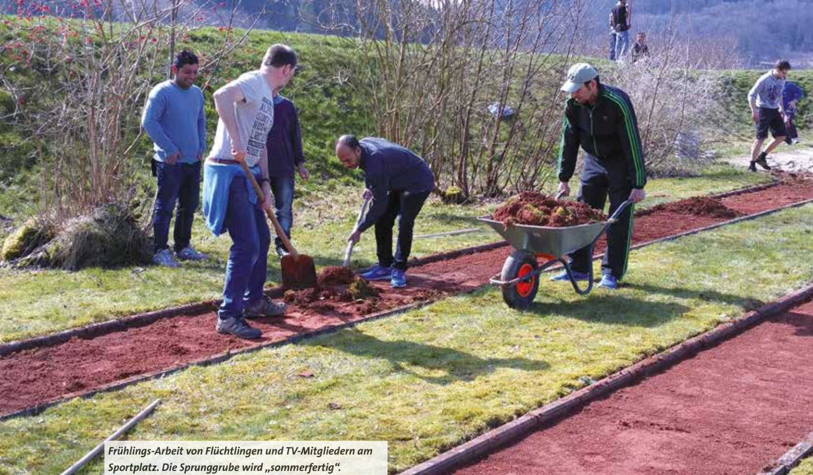
Frühlings-Arbeit von Flüchtlingen und TV-Mitgliedern am Sportplatz. Die Sprunggrube wird „sommerfertig“.