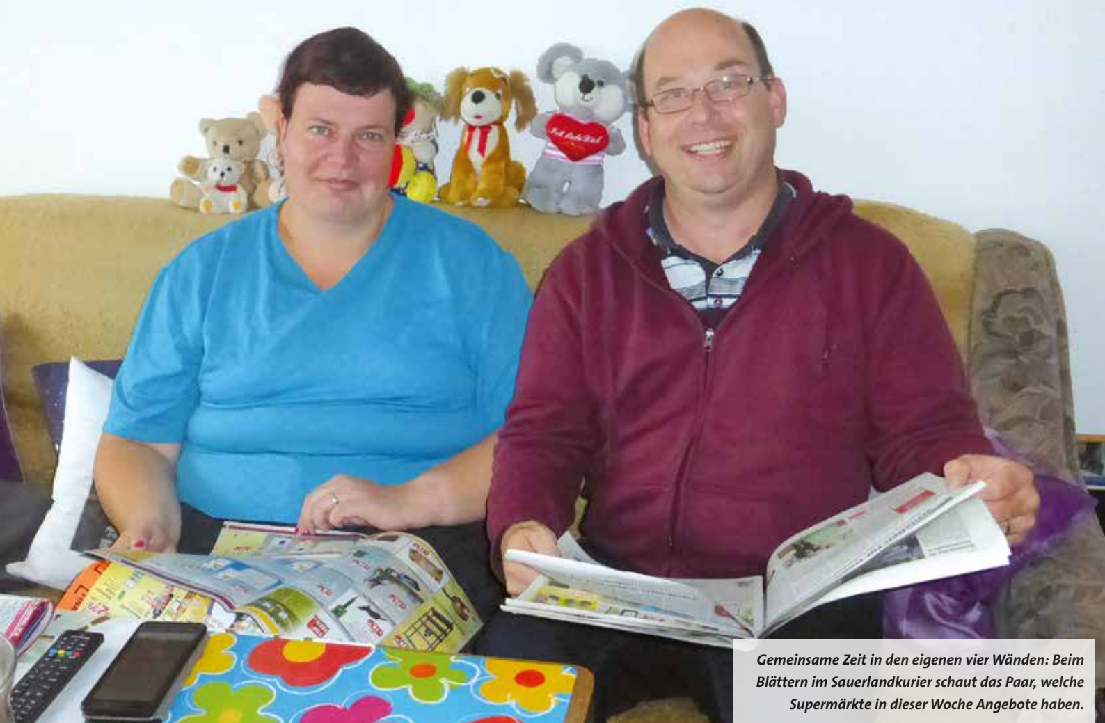
Gemeinsame Zeit in den eigenen vier Wänden: Beim Blättern im Sauerlandkurier schaut das Paar, welche Supermärkte in dieser Woche Angebote haben.