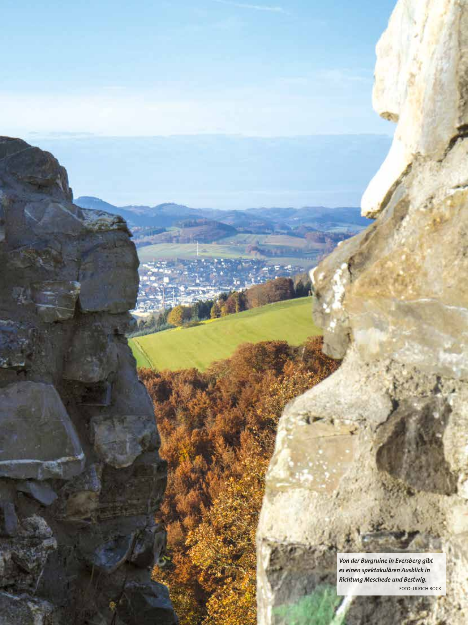
Von der Burgruine in Eversberg gibt es einen spektakulären Ausblick in Richtung Meschede und Bestwig.