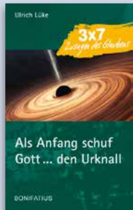
Ulrich Lüke ALS ANFANG SCHUF GOTT ... DEN URKNALL 3 x 7 Zusagen des Glaubens

Kartonierte, 116 Seiten ISBN 978-3-89710-621-5 Juli 2015 € 13,90