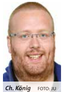
Ch. König

König: Ich glaube, wir müssen nicht „mithalten“. Die Frohe Botschaft ist kein Produkt, welches wir verkaufen müssen. In unseren Veranstaltungen, beim Klettern, Wandern aber auch im Gottesdienst und in der Gemeinschaft laden wir Menschen ein, sich mit ihrer Spiritualität zu beschäftigen. Wir bieten Antwortmöglichkeiten aber auch „Reibungsfläche“, um dem eigenen Glauben auf die Spur zu kommen.