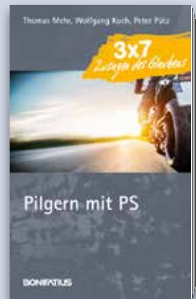
Mehr | Koch | Pütz PILGERN MIT PS 3 x 7 Zusagen des Glaubens

Kartonierte, 112 Seiten ISBN 978-3-89710-676-5 Januar 2017 € 9,90