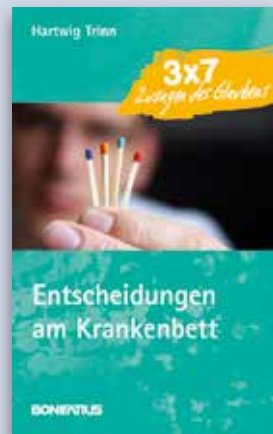
Hartwig Trinn ENTSCHEIDUNGEN AM KRANKENBETT 3 x 7 Zusagen des Glaubens

Kartonierte, 124 Seiten ISBN 978-3-89710-668-0 Mai 2016 € 9,90