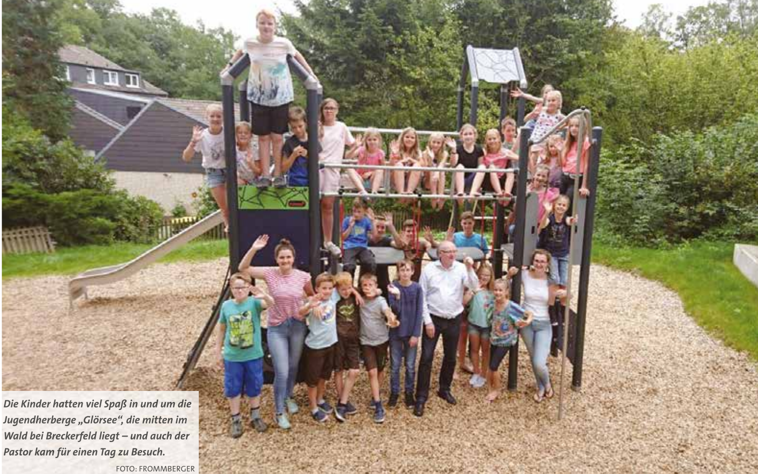
Die Kinder hatten viel Spaß in und um die Jugendherberge „Glörsee“, die mitten im Wald bei Breckerfeld liegt – und auch der Pastor kam für einen Tag zu Besuch.