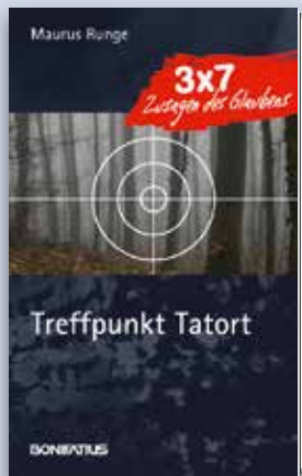
Maurus Runge TREFFPUNKT TATORT 3 x 7 Zusagen des Glaubens

Sonntagabends wird im Fernsehen gemordet nach allen Regeln der Kunst. Ist das nun das richtige Umfeld für ein Glaubensbuch aus der Feder eines Mönches? Aber ja! Denn im „Tatort“ geht es um Leben und Tod, um Gerechtigkeit und Rache, um Liebe und andere Tragödien und vor allem um den Sieg des Guten über das Böse. Kurz: die großen Themen des Lebens. Und damit auch um die Themen des christlichen Glaubens.