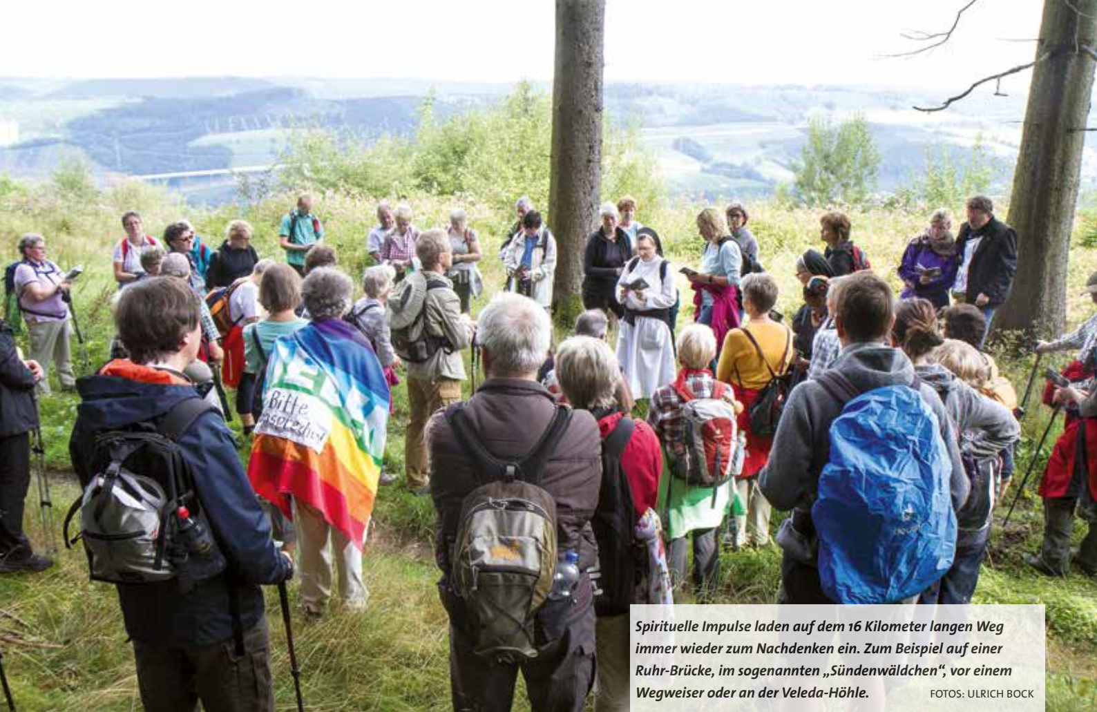
Spirituelle Impulse laden auf dem 16 Kilometer langen Weg immer wieder zum Nachdenken ein. Zum Beispiel auf einer Ruhr-Brücke, im sogenannten „Sündenwäldchen“, vor einem Wegweiser oder an der Velede-Höhle.