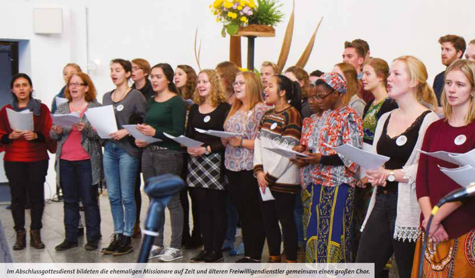
Im Abschlussgottesdienst bildeten die ehemaligen Missionare auf Zeit und älteren Freiwilligendienstler gemeinsam einen großen Chor.