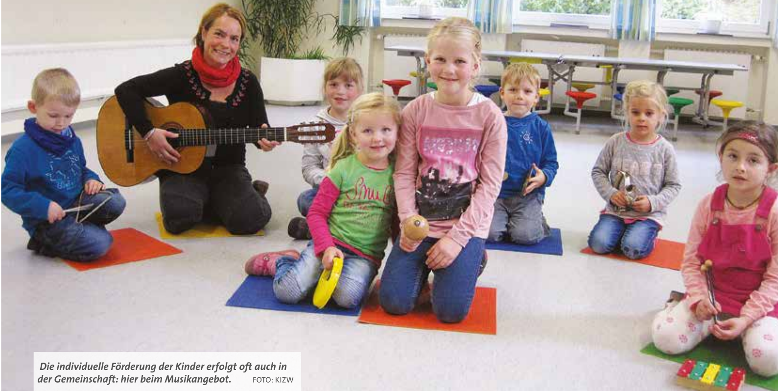
Die individuelle Förderung der Kinder erfolgt oft auch in der Gemeinschaft: hier beim Musikangebot.