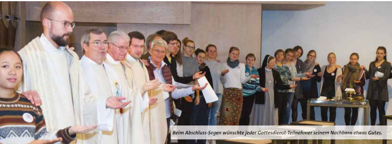
Beim Abschluss-Segen wünschte jeder Gottesdienst-Teilnehmer seinem Nachbarn etwas Gutes.