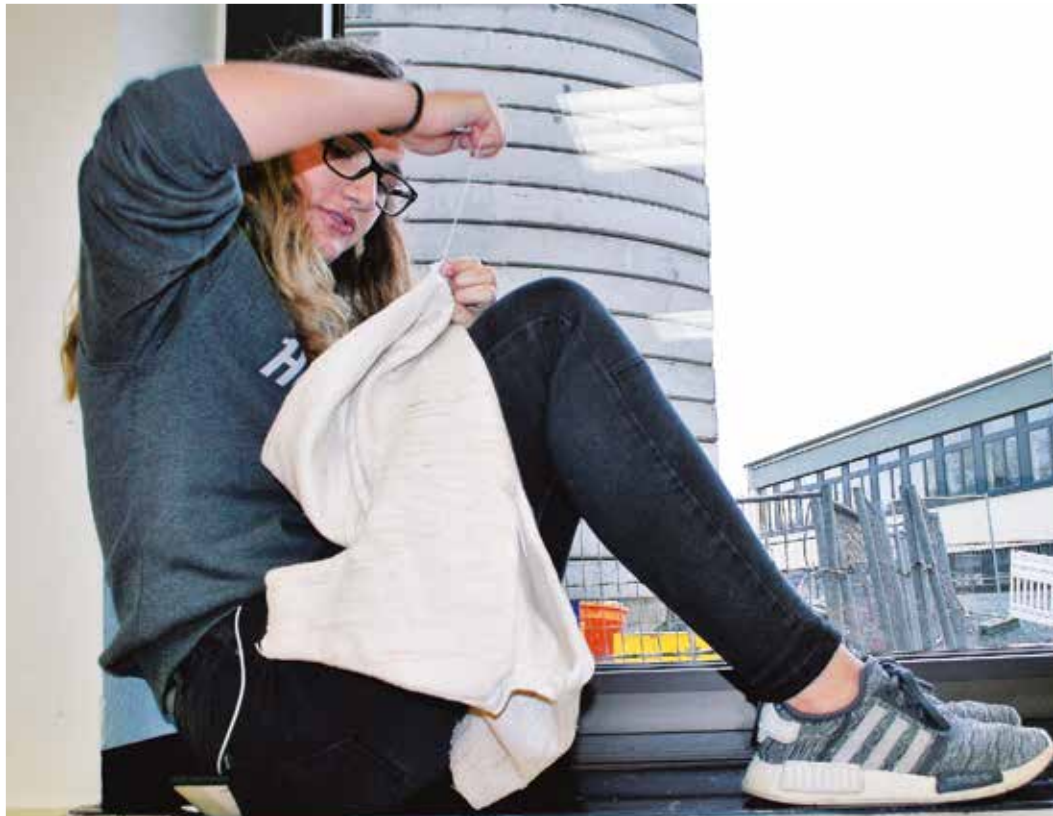
Die Stoffe wurden sorgfältig zugeschnitten (Foto unten), bevor es ans Nähen ging.