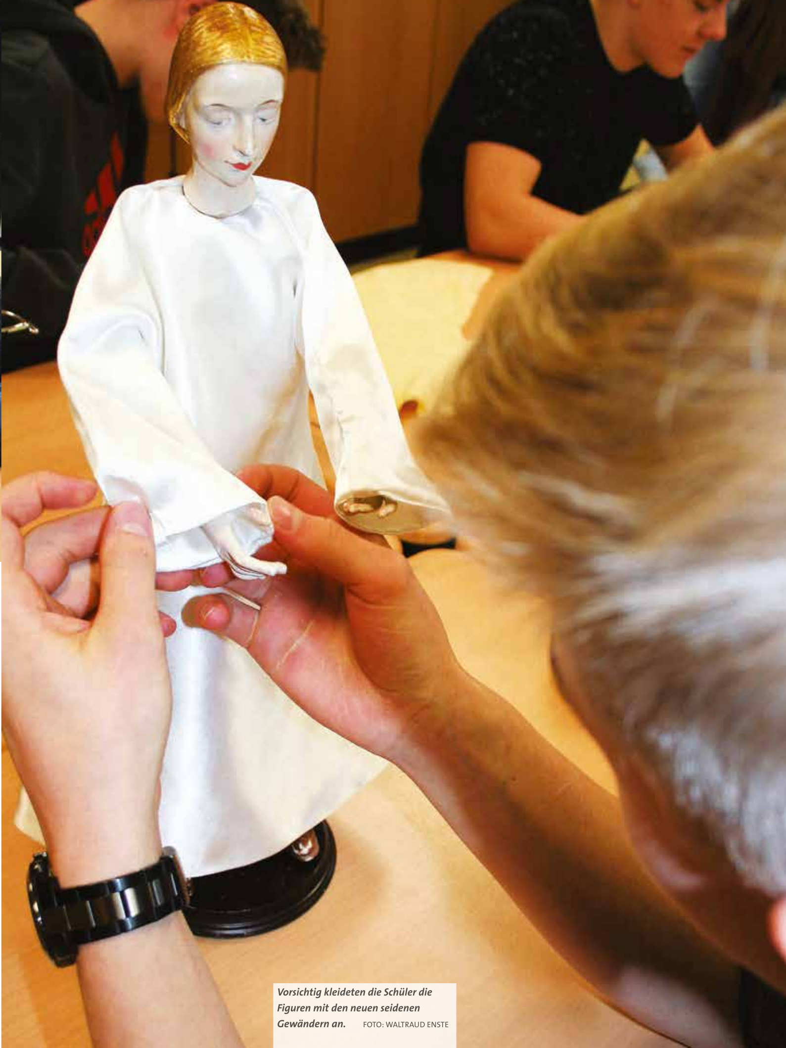
Vorsichtig kleideten die Schüler die Figuren mit den neuen seidenen Gewändern an.