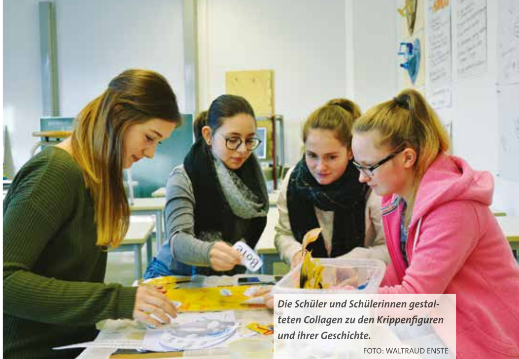
Die Schüler und Schülerinnen gestalten Collagen zu den Krippenfiguren und ihrer Geschichte.