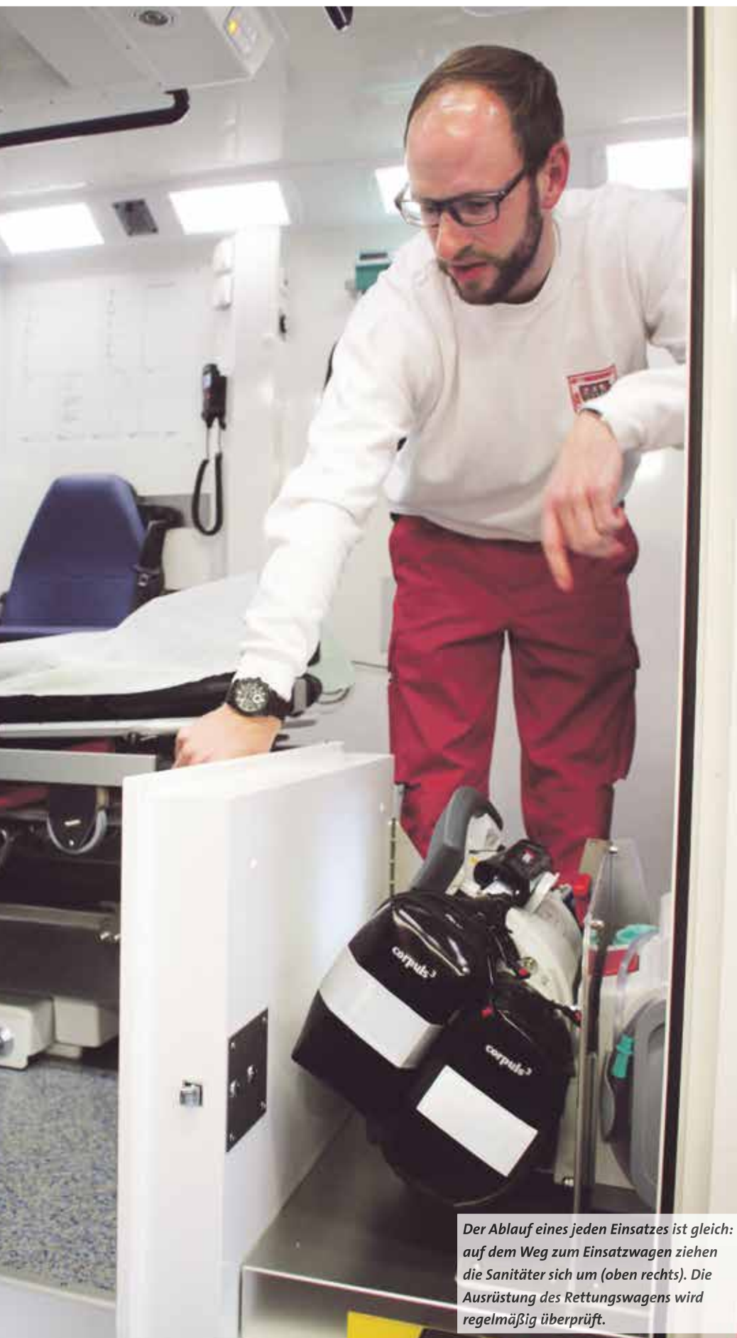
Der Ablauf eines jeden Einsatzes ist gleich: auf dem Weg zum Einsatzwagen ziehen die Sanitäter sich um (oben rechts). Die Ausrüstung des Rettungswagens wird regelmäßig überprüft.