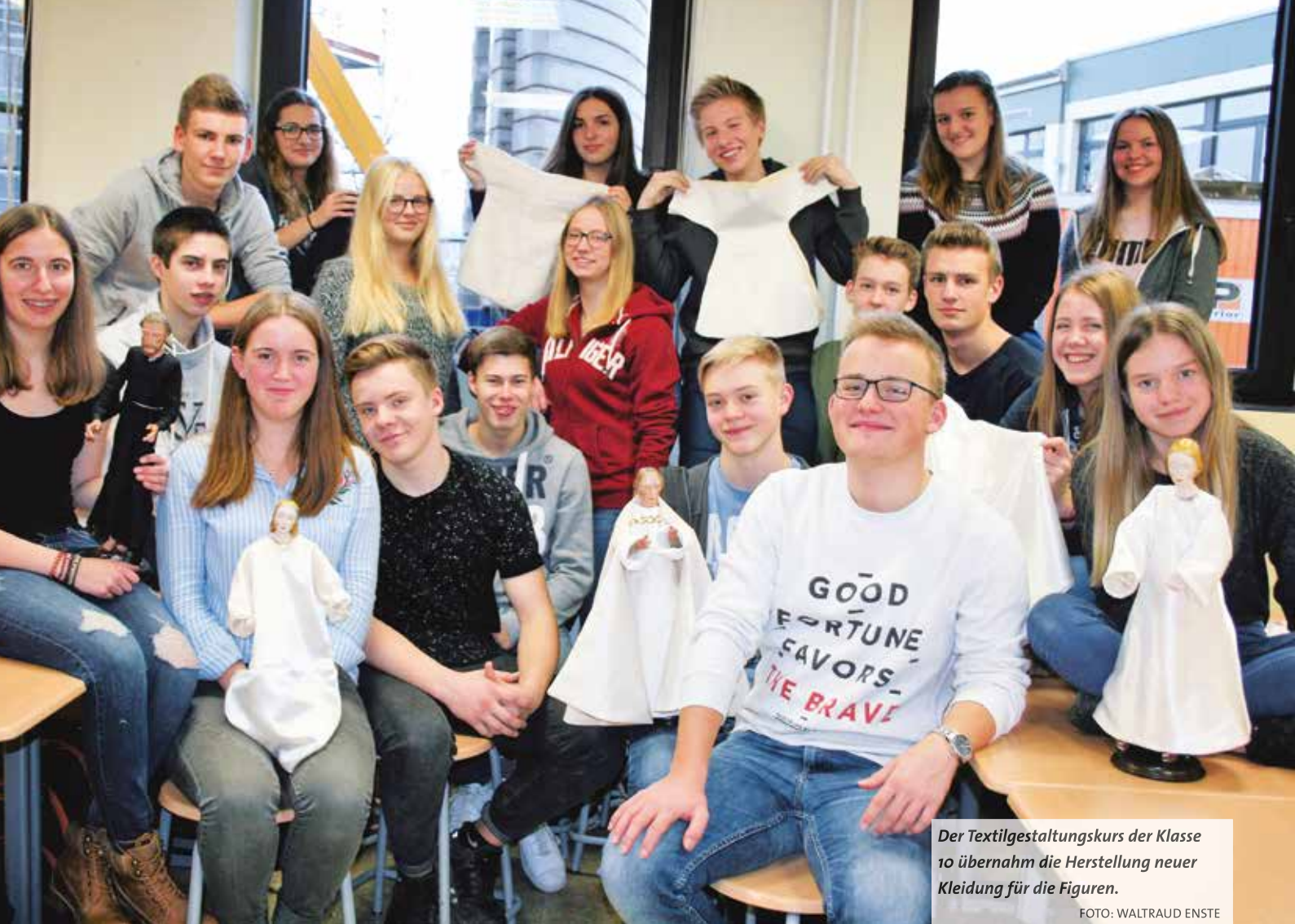
Der Textilgestaltungskurs der Klasse 10 übernahm die Herstellung neuer Kleidung für die Figuren.

glaublich, aber echt wahr.“ Derweil ahnte die übrige Schulgemeinde noch nichts. Erst durch die Lehrerkonferenz vor den Herbstferien erfuhr die breite Schulöffentlichkeit davon, was da auf sie zukam. Das Krippen-Team, mittlerweile um Thomas Fildhaut und Sabrina Ophoven erweitert, erläuterte den Projektplan und mobilisierte die ganze Schule. Jede Klasse übernahm nun die Paten-