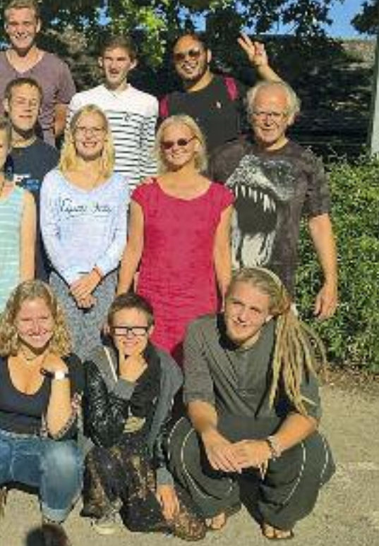
Ein Jahr in Taizé.