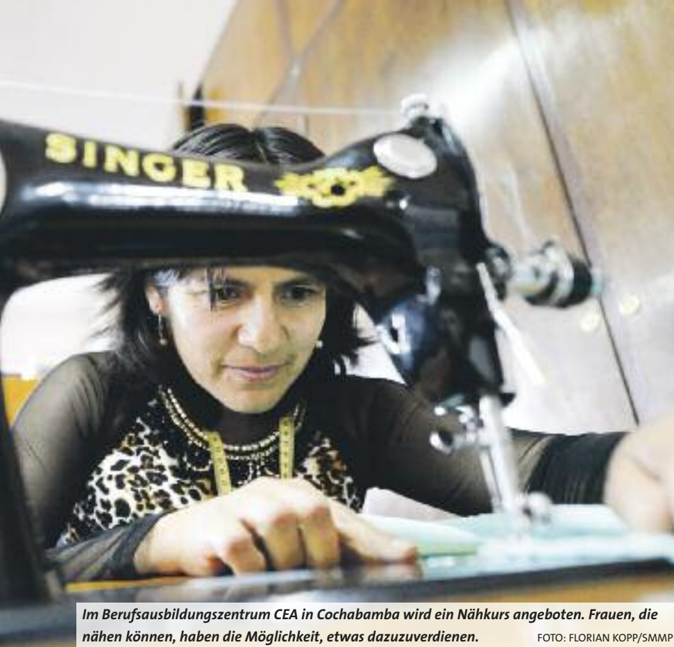
Im Berufsausbildungszentrum CEA in Cochabamba wird ein Nähkurs angeboten. Frauen, die nähen können, haben die Möglichkeit, etwas dazuzuverdienen.