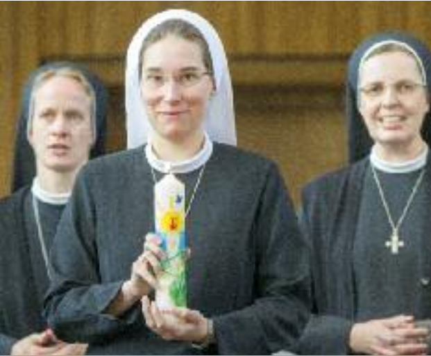
Jubiläum 50 Jahre Bergkloster Bestwig