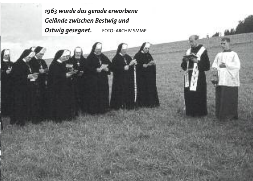
1963 wurde das gerade erworbene Gelände zwischen Bestwig und Ostwig gesegnet.