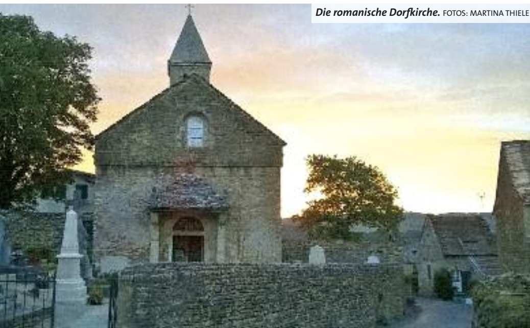
Die romanische Dorfkirche.

Über die Jahre ist Taizé immer mehr zu einer Anlaufstelle für junge Menschen geworden. Diese sind auf der Suche nach den verschiedensten Dingen – nach einer Auszeit vom Alltag, nach sich selbst oder nach dem eigenen Platz in der Welt, aber auch auf der Suche nach Gott und dem persönlichen