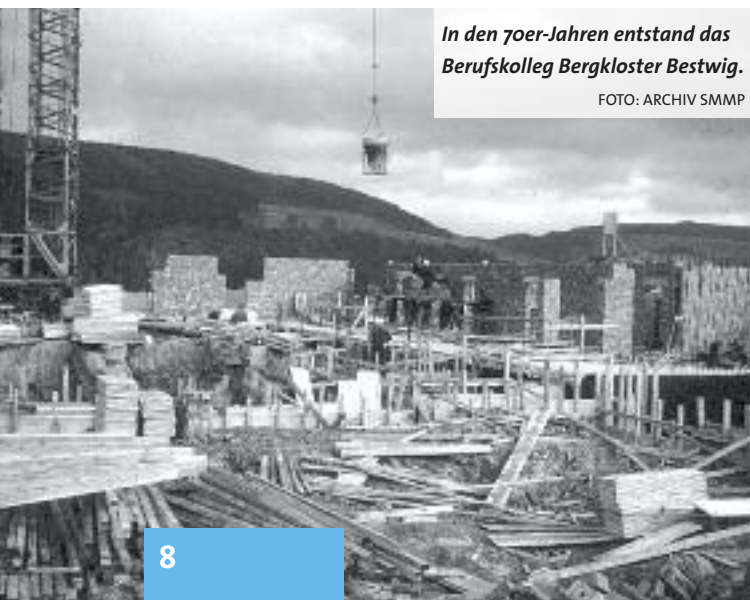
In den 70er-Jahren entstand das Berufskolleg Bergkloster Bestwig.

Zudem richtet sich der Blick vom Bergkloster aus in andere Länder und Kontinente: durch den Sitz der Europäischen Ordensprovinz, zu der die Niederlassungen in den Niederlanden und Rumänien gehören, die Missionszentrale oder die Bergkloster Stiftung SMMP. Angesichts dieser vielen Entwicklungen ist Schwester Johanna für die Zukunft des Bergklosters optimistisch: „Wir werden Suchende bleiben, in unserer Mitte immer eine Kirche behalten und weiterhin für andere Menschen und Ideen offen sein.“ Einen Stillstand gebe es im Bergkloster nicht.