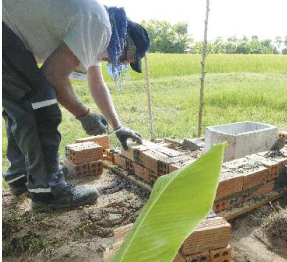
Eine andere Auszeit: Anstatt Patienten zu behandeln, mauerten die Ärzte Fundamente für ein bisschen mehr Hygiene und Privatsphäre in Kambodscha.

Das war nur ein Teil der für die Ärzte ungewohnten körperlichen Arbeit – für jede Toilette, die neben den Wohnhütten gebaut wurde, musste eine zwei Meter tiefe Grube ausgehoben werden. Über die kam ein ent-