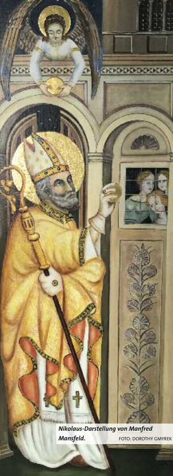
Nikolaus-Darstellung von Manfred Mansfeld.