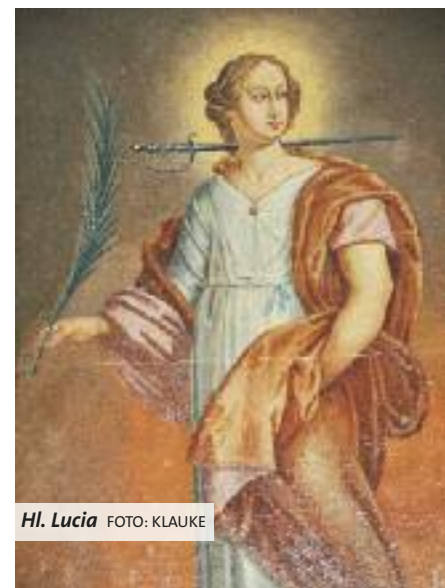
Hl. Lucia

Bei Lucia Sch. spielte der Zufall bei der Namensauswahl mit: „Auf einer Zugfahrt von Wenholthausen nach Meschede in der Zeit ihrer Schwangerschaft hörte meine Mutter, wie eine Frau ihr Kind Lucia zu sich rief. Ihr gefiel der Name und meine Eltern gaben mir den Namen Lucia.“ Aber die heute 59-Jährige ist damit auf jeden Fall zufrieden: „Ich kenne die Geschichten und Legenden der Heiligen. Sie wird in Schweden besonders gefeiert. Licht oder die Leuchtende heißt der Name übersetzt. Das gefällt mir.“ Der Namenstag ist für die Meschederin allerdings weniger wich-