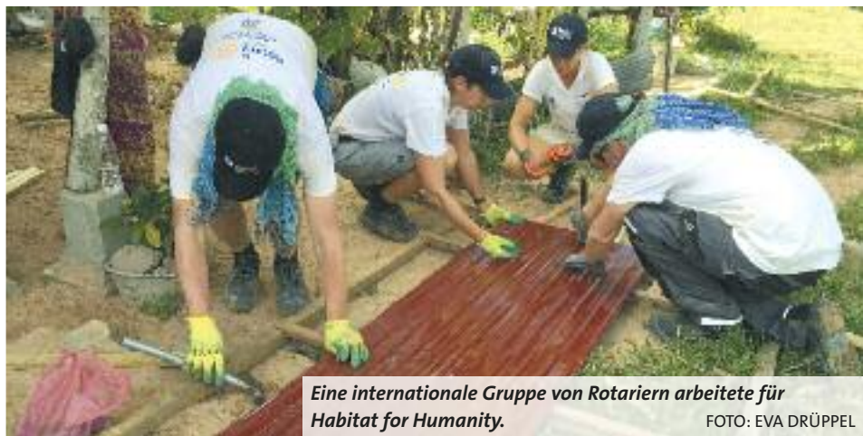
Eine internationale Gruppe von Rotariern arbeitete für Habitat for Humanity.