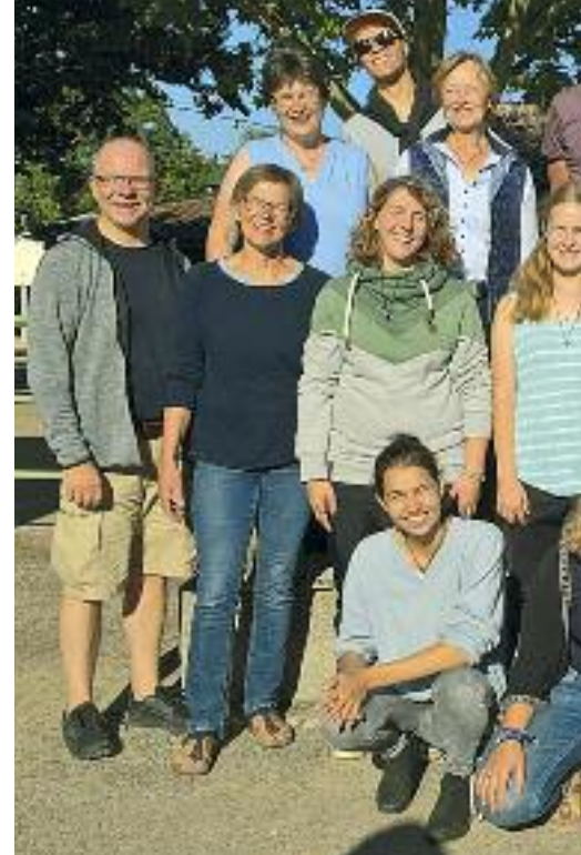
Eine bunt gemischte Gruppe aus Meschede war in diesem Jahr in Taizé.

Frère Roger wurde am 16. August 2005 im Alter von 90 Jahren während des Abendgebetes in der Kirche in Taizé getötet. Über sein Erbe sagte sein Nachfolger, Frère Alois, den tausenden, vorwiegend jungen Menschen, die immer wieder nach Taizé kommen: „Seit über 50 Jahren sind mehrere Generationen von Jugendlichen auf unseren Hügel gekommen. Für uns Brüder ist es eine Freude, euch