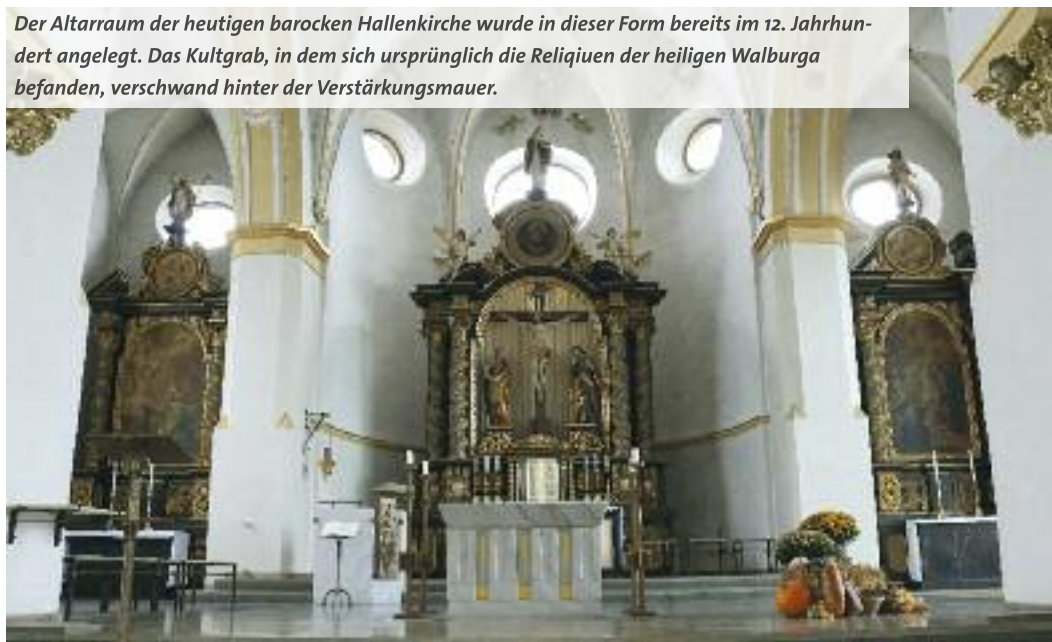
Der Altarraum der heutigen barocken Hallenkirche wurde in dieser Form bereits im 12. Jahrhundert angelegt. Das Kultgrab, in dem sich ursprünglich die Reliquien der heiligen Walburga befanden, verschwand hinter der Verstärkungsmauer.