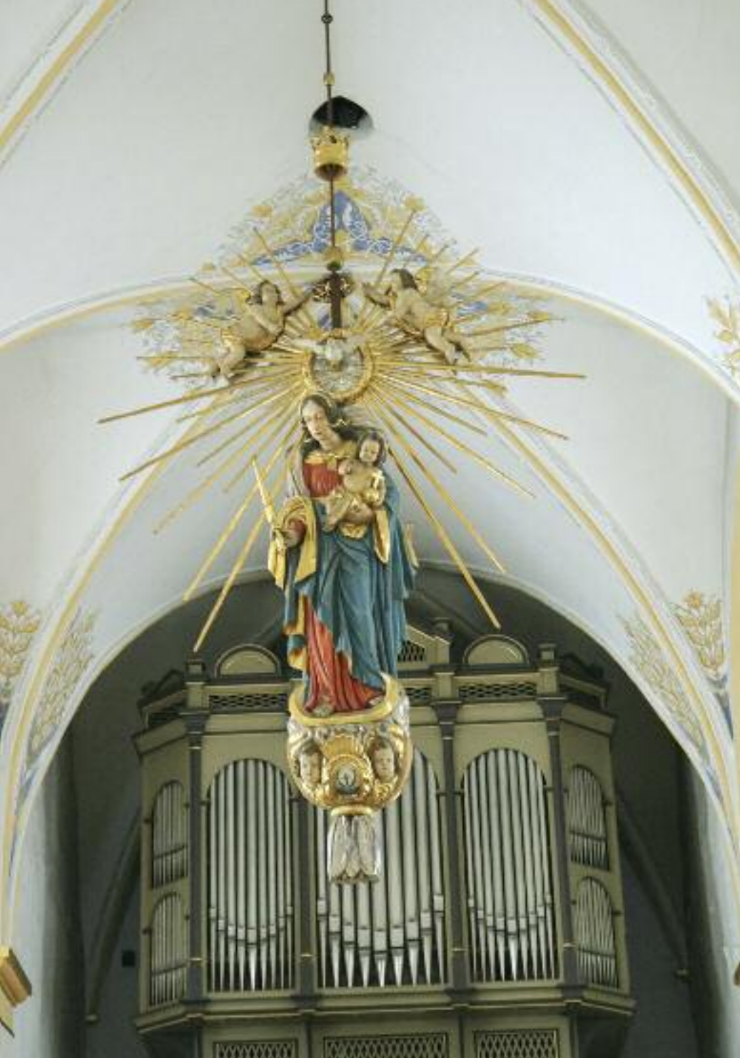
Kirche und Schatzkammer von St. Walburga bergen zahlreiche Zeugnisse der außergewöhnlichen Geschichte der Kirche.