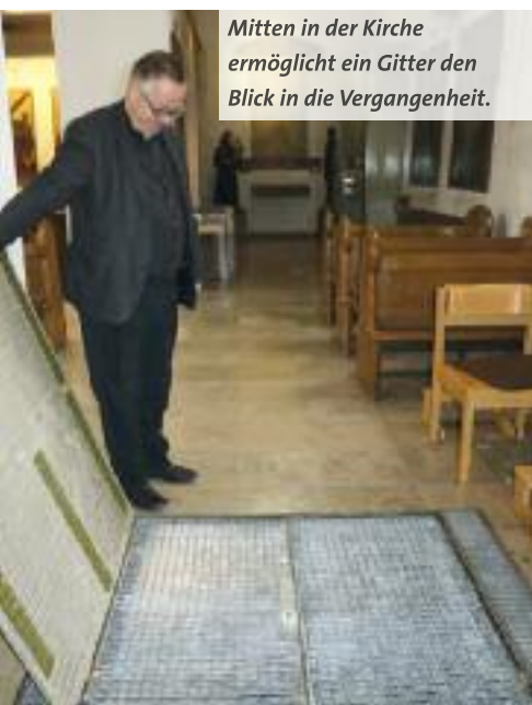
Mitten in der Kirche ermöglicht ein Gitter den Blick in die Vergangenheit.

Und viele Zeugnisse der frühesten Kirchengeschichte sind heute sichtbar, manches unmittelbar, manches erst bei genauem Hinsehen. Letzteres gilt zum Beispiel für Konturen der allerersten Kirchenfenster an der Seitenwand. Sie sind schwach unter dem Anstrich zu erkennen. Als die Kirche im 12. Jahrhundert im romanischen Stil erneuert wurde, wurde der Boden des Chorraums um etwa einen Meter erhöht, nach dem Dreißigjährigem Krieg auch das Kirchenschiff, wodurch diese Fensterkonturen nun unter den eigentlichen, jetzt sehr viel größeren Kirchenfenstern liegen. Das bedeutet aber auch, dass die Archäologen unter dem heutigen Kirchenboden äußerst